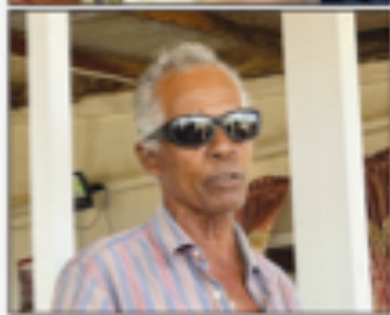
E ta den proseso