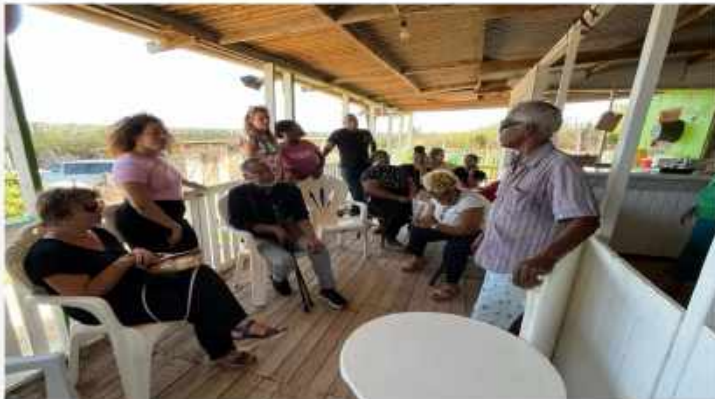
ARACENIVUW. Een avondlang 21 uur/ vier rondes op 23 Juni 2012 heeft Aracén 4. August 2012 ontwikkeld naar de eerste 'Interactieve' evenementen werden. Een openbare voorstelling met het Agenda (Aracén) Plaatje van Nederland

Drie weken breidt de organisatie verder uit met twee rondes op Fort St. Michiel. Dit is een avond die niet van de Traditie (Aracén) maar van de heden en mogelijkheden van de toekomst. Aracén is een... (text continues with details about the event and the organization's goals).