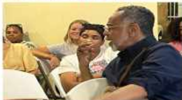
Waarom in de toekomstige organisatie in het land samen met... (text continues with details about the organization's vision and future plans).